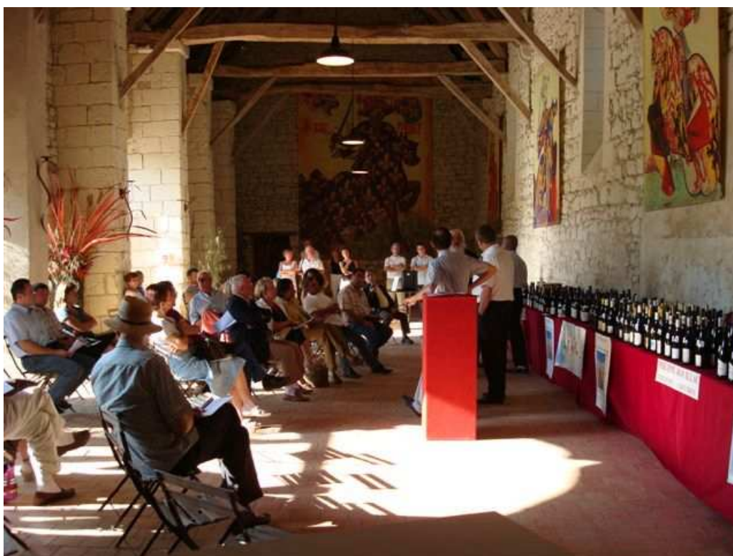
L'assistance est réunie autour des bouteilles des vins de Loire dans le prestigieux cadre du Château du Rivau.